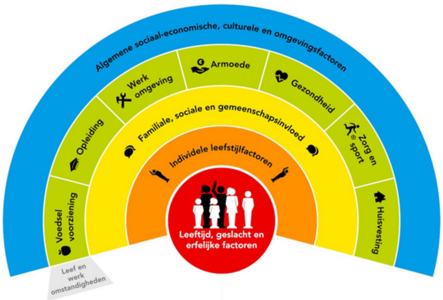
Afbeelding 2. Welke factoren bepalen iemands gezondheid? Het model van Dahlgren en Whitehead.

Uit de brede definitie van gezondheid volgt dat gezondheid niet alleen afhankelijk is van individuele gedragskeuzes, maar samenhangt met allerlei levensdomeinen. Ze wordt in belangrijke mate buiten de zorg bepaald. De gezondheid van inwoners is dus in grote mate afhankelijk van beleidsbeslissingen op andere terreinen dan die van de publieke gezondheid, zoals onderwijs, opvoeding, sociaal beleid, werk en inkomen, wonen, sport en bewegen, cultuur, openbare ruimte, economie en veiligheid (zie afbeelding 2).